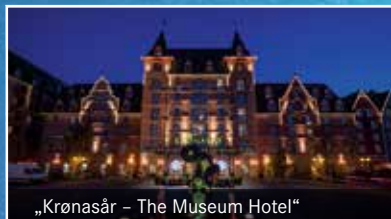
„Krónasár – The Museum Hotel“